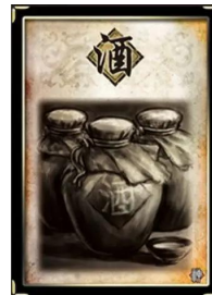
Fig. 5 - “酒”濒死回复体力考据

该说法在《三国杀》中亦有佐证，众所周知，三国杀指出：“在角色濒死前，可用酒回复一点体力”。因此，新三国一些熟悉天意的人物善于使用这一特性。