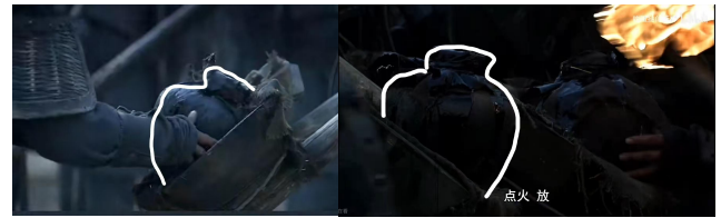
Fig. 12 - 火焰流星雨本质考据

学者经常将其当做新三科技产物，但是，主包在哔站评论区发现了一个事实，让人十分震惊：