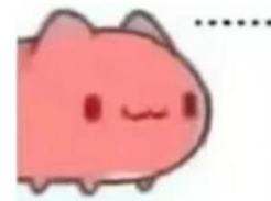
Fig. 3 - 哪来的 263 处！就算是 263 个馒头，主包都得啃十天半月！幸好我做的不是全啃.....