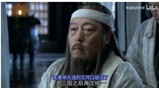
Fig. 9 - 天意爷开口考据

列位诸公可能觉得这有些突兀，为什么其他人并没有这样的操作。其实也是巨有证据的：因为曹操籍贯是沛国樵县，而这里有享誉新三世界的沛国佳酿，这是抵御天意侵蚀的极品，曹氏住在原产地，自然是更加懂得“酒”的用法的。因此进一步还可以推断，后续的天意爷可能是曹操召唤的结果。