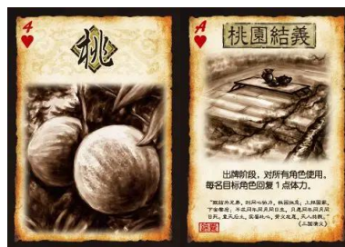
Fig. 6 - “桃”回复体力考据

由此，我们还可以引申另一个隐藏的机制： 桃可能是一种缔约天意的圣物。 众所周知，在三国杀中，“桃”可以恢复一点体力，锦囊牌“桃园结义”可以让全体角色回复一点体力。