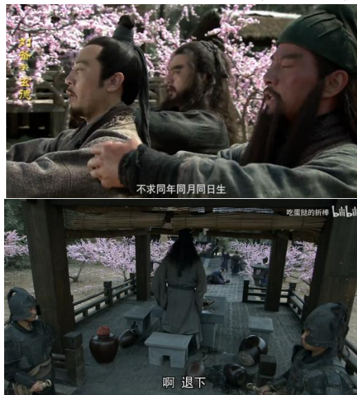
Fig. 7 - 上图为桃园结义，下图为张飞古城角斗场