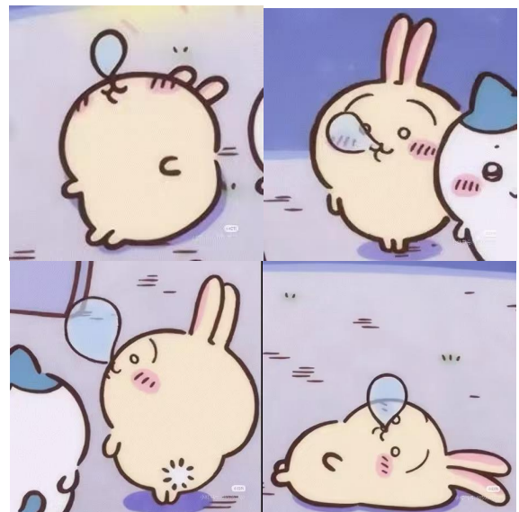
Fig. 12 - 一组无意义的乌萨奇配图