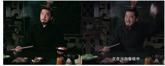
Fig. 2 - 好“概”啊，比曹操盖饭还要好啊！

说起新三国“酒”文化概况，主包一句话解释： 概不起来 .....但是为了新三科学的严谨规范，我还是概了（竟然许了）！