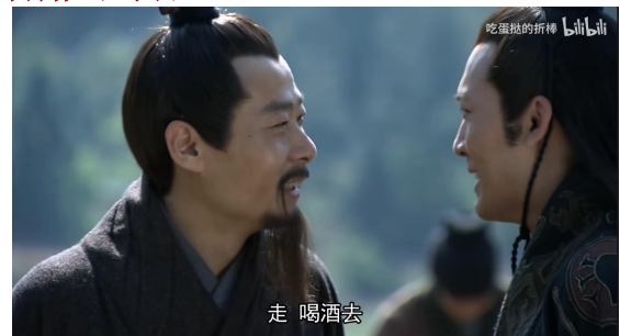
Fig. 13 - “走，喝酒去”考据

现象表现在： 孙十万合肥诈败送掉太史慈后，听说刘琦下线的消息立即兴高采烈地和鲁肃去喝酒。