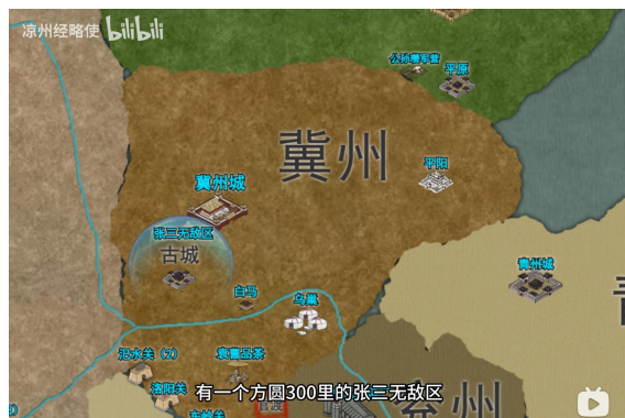
Fig. 9 - 张飞爷古城“方圆三百里无敌区”考据（哔站 UP 凉州经略使《新三国地图 2.0》）

此外，在古城张飞拥有一个方圆三百里无的敌区域，正是这段时间天天饮酒、武力爆表的体现。