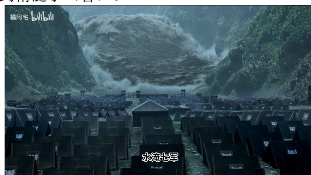
Fig. 10 - 关羽爷水漫金山考据

“酒圣”关羽，对“酒”机制的运用更是遥遥领先于蜀国大部分人。关羽爷可能是通过“酒”机制增加“幸运”属性，因此在单刀赴会和襄樊之战全程喝酒，获得“酒圣”标记，无法造成伤害，这也揭示了为什么要“换大盏”，因为喝的酒越多，技能越高明。在华佗“刮骨疗毒”的过程中，关羽也在饮酒，其实并非在英气逼人，而是通过酒降低医官“医术高明”伤害。并且在“酒圣”点数足够的时候，可以召唤洪水“水淹七军”。因此我们还能引申出，关羽爷读兵法确实读到精髓了（喜）。