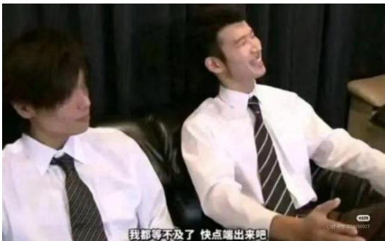
Fig. 1 - 氛围插图（看懂就看懂，别重点关注这个；看不懂也别去了解，我不希望.....）