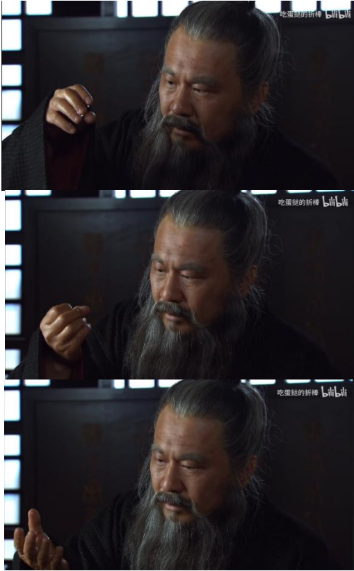
Fig. 8 - 曹操下线前发动弹指神功考据（你要是注意到了什么，那就是主包故意的（手动狗头 Doge））

此外，曹操下线前的操作可能为我们展示了“酒”抵御天意侵蚀的原理。我们观察到曹操在这一时刻发动了弹指神功：