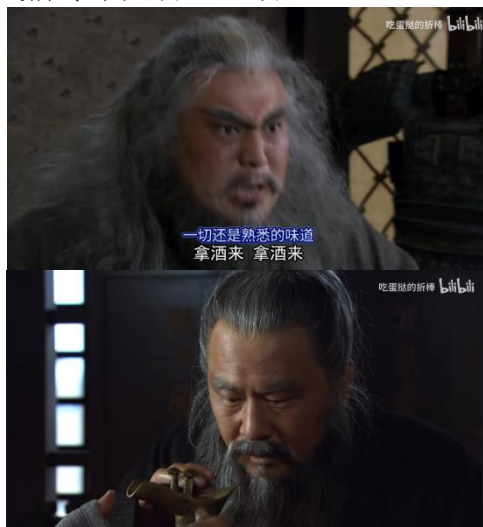
Fig. 4 - “酒”抵御天意侵蚀现象考据

这是已知由折棒爷推断的一个“酒”机制： 新三人物下线前通过喝酒延续存在，因此“酒”可能是抵御天意侵蚀的一种方式。 如，张飞爷下线前在军营痛饮庆功酒，曹操爷下线前令下人曹丕上酒。