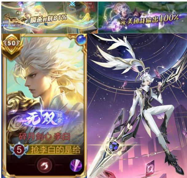
图1. 李白无双皮肤-碎月剑心与韩信无双皮肤-群星魔术师