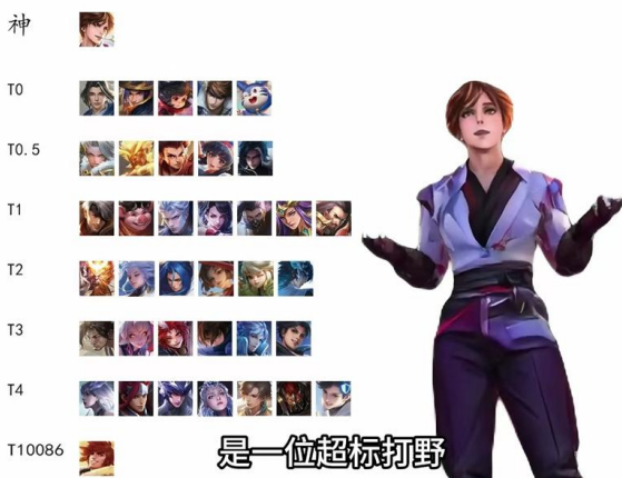
图6. 打野T0到T10086分级梯度表