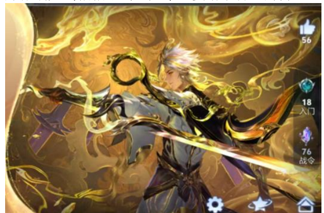
图4. 东方曜无双皮肤-璃龙剑展示图

今年春节璃龙剑复刻引起作者大破防，因为作者真的玩李白也真的觉得璃龙剑很帅，最后钱包被王者荣耀狠狠狙击。作者曾经好友名片对着哥们的那张璃龙剑狠狠眼馋，如今已宴请了曾经的自己。