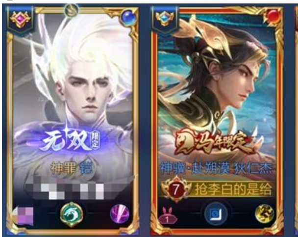
图2. 凯无双皮肤-神罪与狄仁杰马年限定横向对比示意图

把照片放在论文上简直是霸凌，截图来源于前些天的一把对局。这两个皮肤一个四百元保底一个只要89大家来猜猜哪个皮肤更贵吧，我说狄仁杰马年限定简直是性价比之王有没有懂的。做人要讲良心！！！！