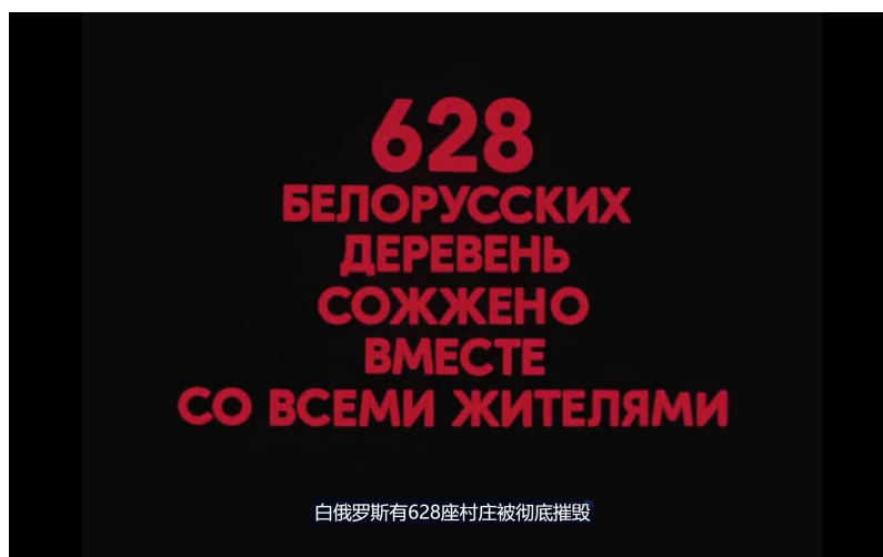
图 4 白俄罗斯电影《自己去看》

近年来的电影总爱把纳粹拍成优雅的反派，让人非常不适。事实上，纳粹一样会焚烧村庄、强暴妇女、掳掠牲畜——他们和日本鬼子一样恶心而滑稽。