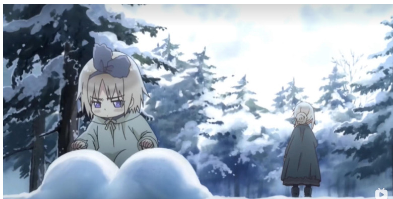
图 2 幼年妹妹可爱捏