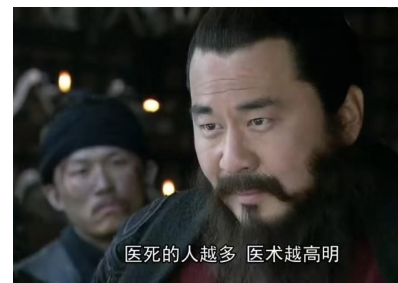
Fig. 2 - 医术高明定律考据