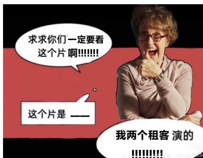
图1 哈德森太太我们爱你